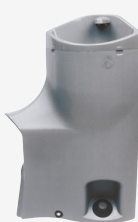
Lavamani Maxim Capacità: 32.5L