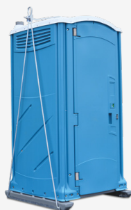
Kit per sollevamento a serbatoio pieno

È possibile aggiungere i seguenti accessori opzionali: dispenser per sapone, dispenser carta/asciugamani, ripiani angolari, indicatori di sesso, specchi, porta carta igienica 4 rotoli ed illuminazione a energia solare e ventola a energia solare.