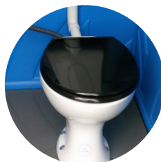
Seduta in plastica ultra resistente & serbatoio ceramica