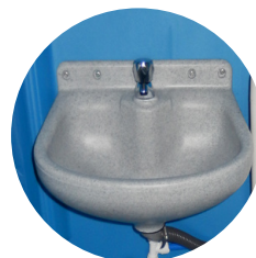
Grande lavamano in plastica