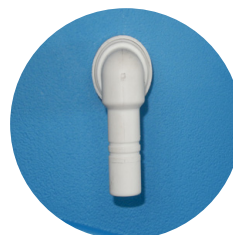
Ingresso acqua pulita sul retro della cabina